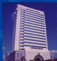
中國信託商業銀行總行