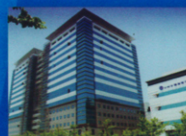
聯華電子企業總部